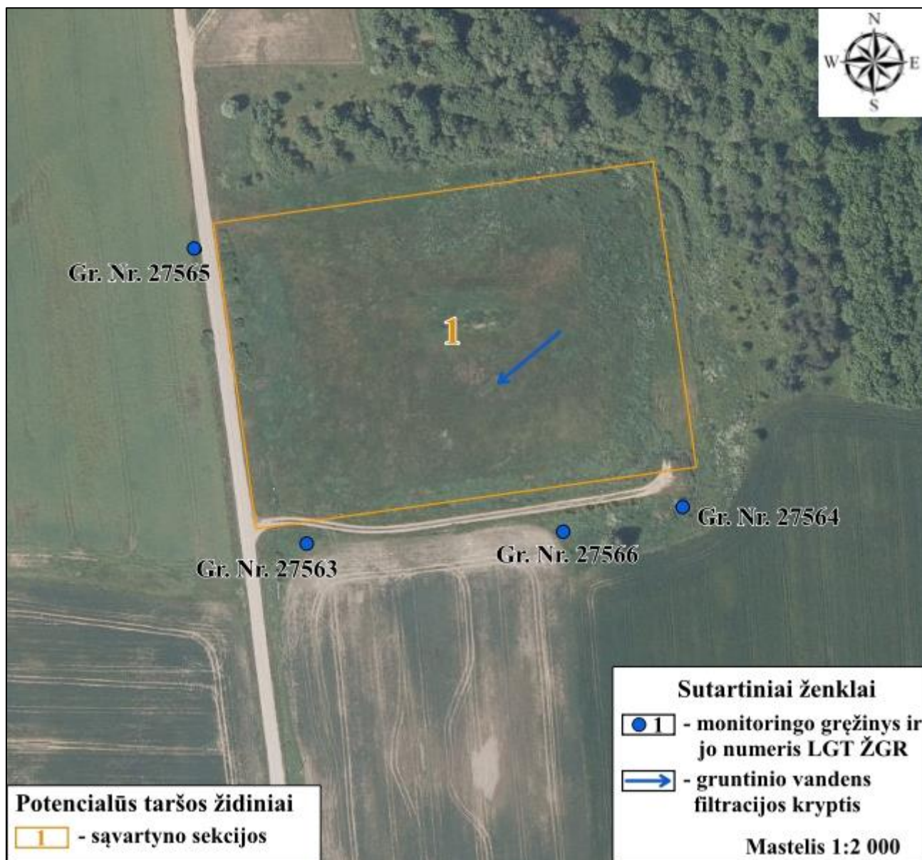
8.1 pav. Sąvartyno teritorijos monitoringo tinklo schema